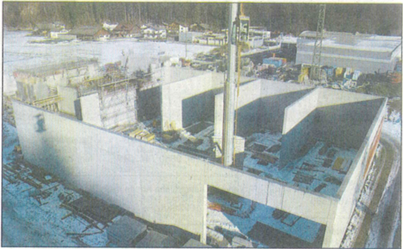
Die Bauarbeiten am Biomasse-Heizkraftwerk „Naturwärme Montafon“ laufen auf Hochtouren.